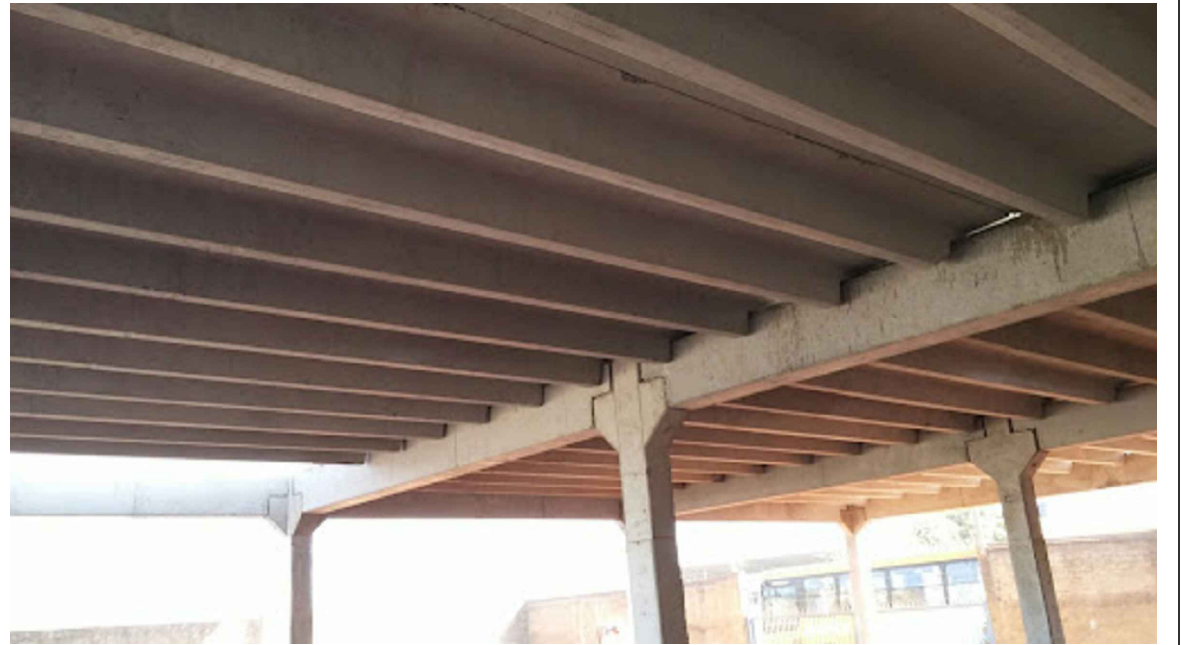
DETALHE LAJE PI MEZANINO E VARANDA